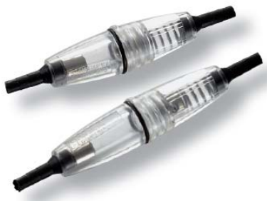
Foto e disegno (dimensioni in mm) / Product image and drawing (dimensions in mm)